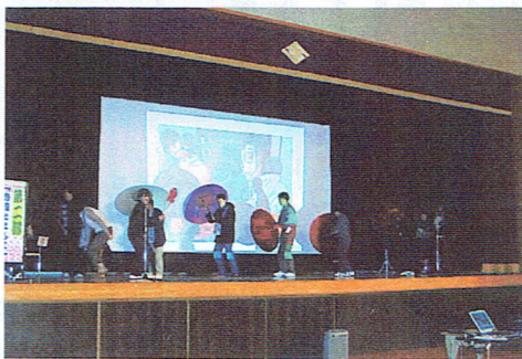
教育課程研究発表を劇で表現

◇◇◇ 当校児童は、大変すばらしい子どもたちばかりですが、「できる」「よくできる」と