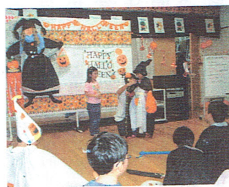
仮装コンテストの表彰式