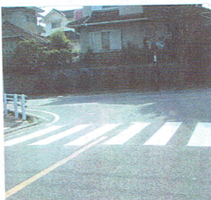
T字路に新設された横断歩道

強い要望があった若草1丁目の幹線道路T字路の信号機新設は、スター前と公民館前の信号機間隔が短いため交通渋滞を引き起こす恐れがあるため不認可となり、代替策として横断歩道が新設されました。