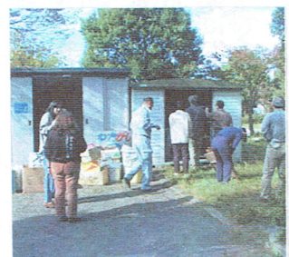
役員さんが協力して倉庫の移設

10月18、19日の両日、各町内会の役員さんの協力を得て、昨年の懸案事項であった、4丁目及び8丁目集会所予定地の倉庫を若草中央公園の一部を市から借用し、移設しました。