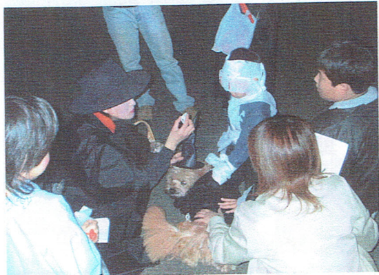
ワンちゃんも仮装してお出迎え