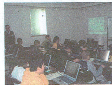
すごろくづくりに挑戦

が参加しました。 カラオケや生演奏をバックにダンスなどで大いに盛り上がり、参加たちがひとつになつて、楽しい時間はあっという間に過ぎてしまいました。