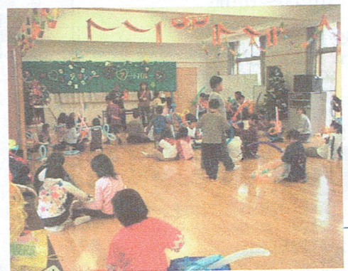
アートバルーンを楽しむ

恒例のわんぱくクラブ南っ子「Xマスをみんな楽しもう」が12月11日（土）、志津南公民館で行われ、南っ子53人が参加しました。