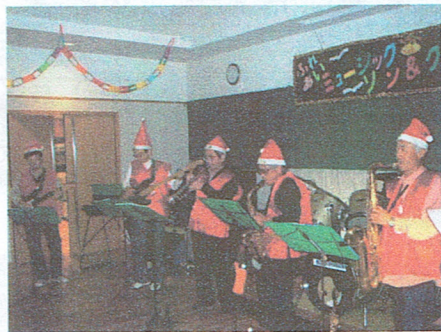
パーティーはGS0の生演奏で

ひと時を過ごしました。 また夜の部は「ふれあいクリスマスパーティー」として、午後6時から、やはり公民館で活動しているダンスやカラオケのサークル、また地域で活躍している軽音楽グループのメンバー