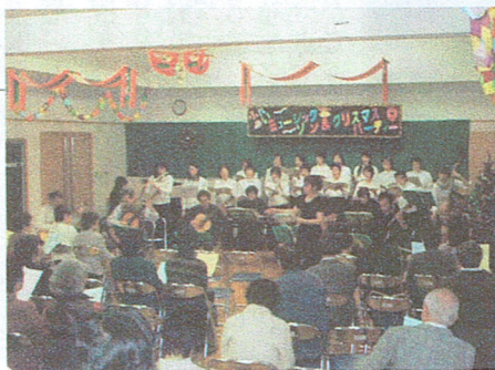
フィナーレは楽しく合唱で

屋の部は「ふれあいミュージックソン」として、午後1時30分から、公民館で活動している音楽関係のサークルや地域の音楽愛好家の皆さんが参加しました。