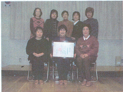
受賞された健康推進員のみなさん

草津市社会福祉協議会の「福祉を考える市民のつどい」が、平成16年11月27日（土）アマカホールで開催されました。