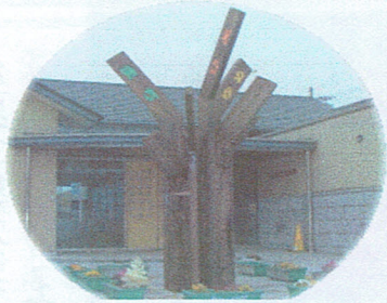
まちのシンボル「ひと・まち・ゆめ」