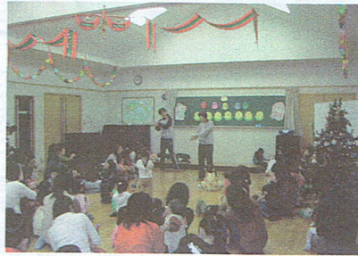
楽しいクリスマス会(志津南公民館)

ラブも、今では岡本、追分、青山など広い地域から親子が参加、総勢100名を超える大所帯に発展しました。毎週火曜日に