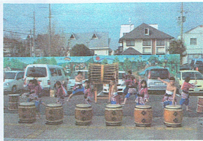
オープニングの和太鼓

「ふれあいミュージックソン&クリスマスパーティー2004」がさる12月18日（土）に志津南公民館で開催されました。