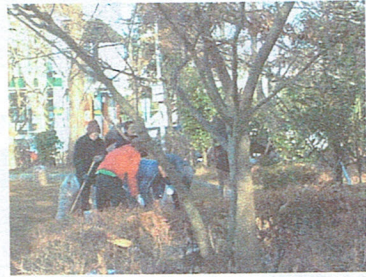
公園の清掃作業（中央公園）

毎月第4土曜日に実施している地域ボランティアの平成16年最後の社会奉仕活動を12月25日（土）午前8時から行いました。