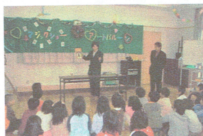
学生のマジックショー

パート1では、立命館大学マジックプレイヤーによる「マジックショー」が披露されました。