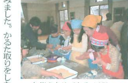
お餅を丸めておみやげに

わんぱくプラザ南っ子恒例の「お餅つきしよう！」が2月12日、志津南公民館で催され、南っ子45人と保護者やお手伝いの地域の人たち30人が参加しました。 今回初めて参加した子どもたちは、キネの重さにびっくりしながらも「べったん、べったん」とキネをふるい、餅つきを楽しみました。 「お餅つきの順番を待っていたグループも、気合十分に次々と餅をつきました。 つきあがったお餅は好きなように丸め、きな粉餅にし持参した弁当箱に詰めて家のおみやげにしました。 その後、参加者全員にふるまわれた、ボランティアの方が作ったせんざいは、寒い中、参加した保護者の心まで温かくしてくれました。 お餅つきイベントは2歳から中学生までの子どもたちと保護者、地域の方の格好のふれあいの場となりました。 (志津南公民館)