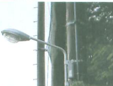
志津南小に設置された防犯灯