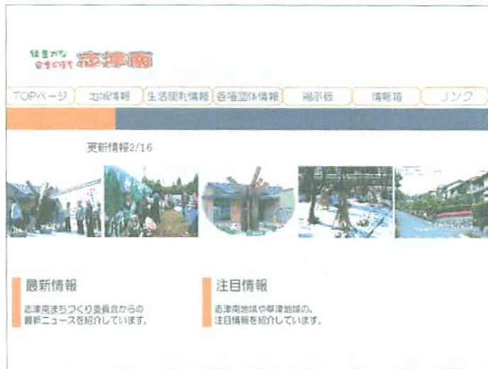
志津南ホームページのトップ画面