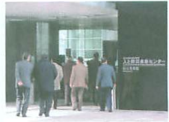
未来センターに向かう参加者

まちづくり委員会は2月19日、委員ら19人が参加して、神戸市中央区にある阪神・淡路大震災記念「人と防災未来センター」を見学する防災研修会を行いました。 「防災未来館」では、地震により崩壊していくビルや高速道路などの迫力ある大型映像や、震災直後の破壊された街並みを再現したジオラマ、復旧から復興へといたる人々の姿を伝えるドキュメンタリー映像などに胸を打たれました。 また「ひと未来館」では立体映像などで命の大切さや力強い自然の生命力など、それぞれ言葉だけでは伝えられないことを実感しました。