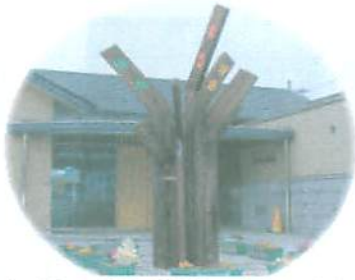
まちのシンボル「ひと・まち・ゆめ」