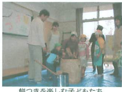
餅つきを楽しむ子どもたち