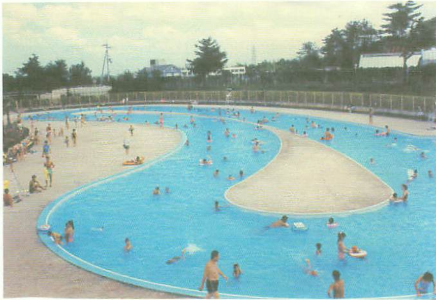
ロクハ公園の流水プール（一周200m・幅8m・水深1m）

梅雨が明ければ、すぐそこに夏。水辺が恋しい季節です。日本一の琵琶湖もさることながら、なんといっても手軽なのは