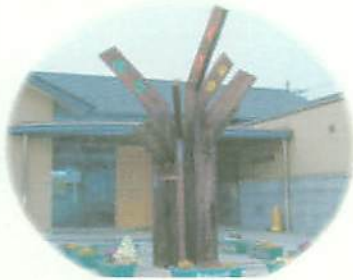
まちのシンボル「ひと・まち・ゆめ」