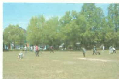
草刈り奉仕する老ク連 (若寿会)

このため、志津南老人クラブ連合会若寿会は5月15日、16日2日間、会員約30人が草刈りの奉仕作業を行いました。おかげでグラウンドは大変さっぱりしました。会員のみなさんありがとうございました。