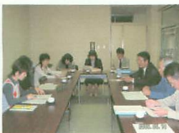
児童の安全めぐり意見を交換

ンティア部会」は、5月10日夜、志津南小会議室で志津南小学校、PTA代表と「児童の安全を守るための活動」について話し合いの場を持ちました。 話し合いを通じ、昨年から毎朝、児童の安全のため、通学路の誘導や学校内の見回りなど、地域の方々のボランティア活動により、児童が安心して登下校できる態勢が整いつつあること