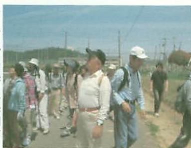
ハイキングを楽しむ参加者

「普段なかなか触れ合う機会が少ない方たちといろいろ話ができ、輪を広げることができました」との感想も聞かれるなど好評でした。