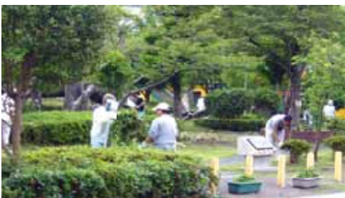
草刈り・剪定に汗流す(中央公園)

安全な町づくり 2つ。 地区計画については、地元からの提議に答えるかたちで市は、市への地区計画届出は、これが必要であるか不要であるか明確にし、事例を積み重ねながら、地元と協議し整備していく。住宅付属の物置や倉庫の大きさの制限についても、地域と協議を行いながら、見直しも含め検討していきたい。地区計画内容については、地権者、県内の民間確認検査機関など県住宅課を通して周知を図っているが、今後は不動産協会、宅建協会等にも拡大し、届出もれをなくすよう対策を講じていきたい。都市計画課と地域で連絡会議を持ち相互に情報交換する場を年に2回程設けたいなどとなりました。