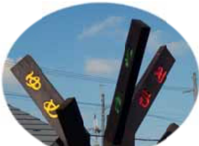
まちのシンボル「ひと・まち・ゆめ」