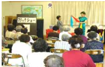
鮮やかなネタさばきに大きな拍手