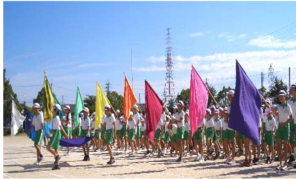
応援旗を先頭に入場、整列する児童たち

を出し、練習はうそをつかない。今日はその成果を發揮しよう」と全児童に呼びかけました。これに呼んで、児童代表、選手が「これまでの成果を發揮しよう」、