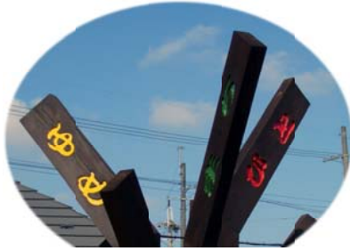
まちのシンボル「ひと・まち・ゆめ」