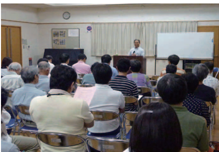
講演に耳を傾ける参加者

会の組織を「活動」を中心にした組織として組み立てました。全戸配布した「組織と活動」「仕組みと運営」について、9月中旬に住民の意見を集約、次回準備会に提示する予定です。