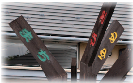
まちのシンボル「ひと・まち・ゆめ」