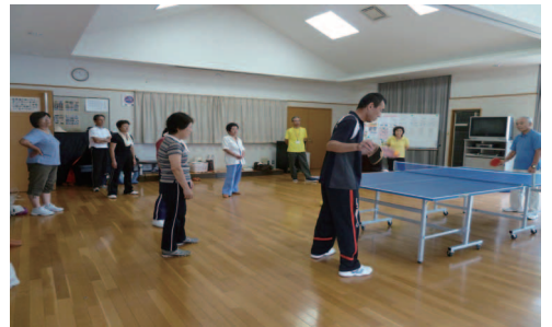
ラリーを楽しむ参加者（市民センター）

志津南市民センターは8月18日、25日、29日の3日間、同センターで「わいわいピンポン教室」を開催、各回約20人の参加者がフリーピンポンと卓球を楽しみました。 ピンポン教室は、高齢者等つどい推進事業として「草津あらしんいきいきプラン」に基づき、高齢者や地域住民の社会参加や生きがいづくりにつながるようにと前回のパソコン講座に続き開催されたものです。 フリーピンポンとは、大きなラケットとテニスボール大のスポーツボールを使って、お互いに相手の打ちやすいように、思いやりの心でラリーを楽しむ「ニュースポーツ」です。往年の卓球少年、少女たちは、はしゃいだり悔しがったりしてさわやかな汗を流しました。 この3回をきっかけに、若さと健康維持のため、ピンポングループが立ち上がる予定です。 皆さんの積極的な参加をお待ちしています。