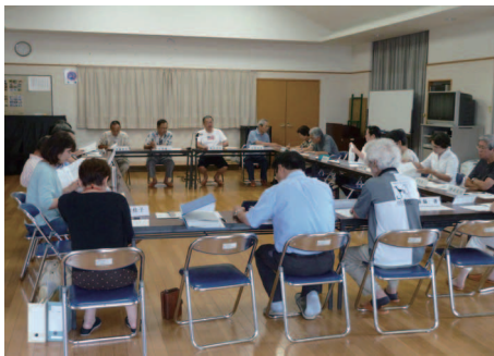
市民センターで開かれた第4回設立準備会