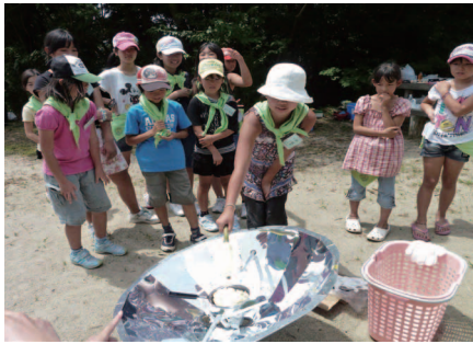
パラソラ型のソーラークッカーでホットケーキを焼く（ロクハ公園）