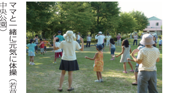
ママと一緒に元気に体操(若草中央公園)

おく殺菌庫も新たに設置することとしています。 11月頃から着工し、来年2月中旬完成の予定です。工事期間中は、一部の部屋が使えなくなったり、駐車スペースが狭くなるなど不便をおかけすることになりますが、ご理解ご協力いただけますようお願いいたします。