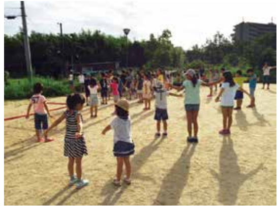
かがやきの丘会場