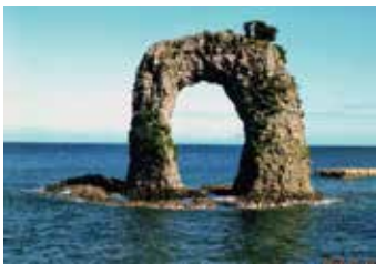
北海道奥尻島の鍋釣岩

北海道の利尻島、礼文島は人気があり、団体ツアーがあるので割愛します。天売島(オロロン島が来島する島)、焼尻島、奥尻島へは3年程前の7月に行きまし