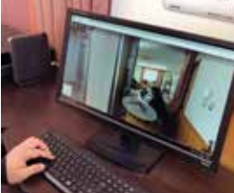
ストリートビュー画面上の地域活動室

世界の町並み風景で知られる「グーグルストリートビュー」の屋内版の撮影が1月12日、志津南まちづくりセンターで行われました。今回の撮影は草津市の企画