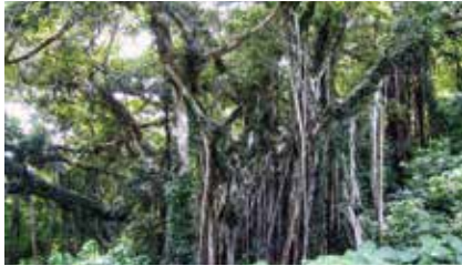
鹿児島県指定の喜界島のガジュマル

た。沖繩本島、宮古島、池間島、來問島、伊良部島、石垣島、西表島、竹富島、波照間島、小浜島等はツアーがあるので割愛します。喜界島は日程の都合上奄美大島から飛行機で行き、レンタカーで一週しました。レン