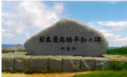
日本最南端平和の碑 (波照間島)

沖繩本島以外の島々を離島と言いますが、一昨年の4月に引越して以来、7か月の間にほとんどの離島に足を伸ばしました。