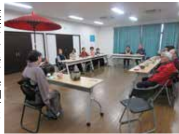
抹茶をいただく参加者たち