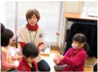
地域の方からお手玉(左)やこま回し(右)を教わる1年生

志津南小学校(水野晃校長)では2月6日、1年生児童が地域の方々と一緒に、さまざまな昔遊びを楽しみ