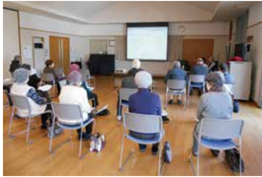
熱心に耳を傾ける学級生

やすらぎ学級第9回講座が2月24日、志津南まちづくりセンターで開催され、学級生20人が参加しました。