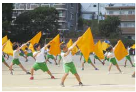
色鮮やかな旗を手に演技する子どもたち

ルス感染拡大防止の観点から、午前中日程で、各家庭2人と人数制限が設けられました。