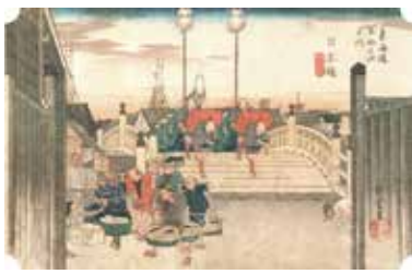
歌川広重「日本橋 朝之景」

その後、小田原宿を経て大磯にある旧吉田茂郎を見学。屋敷は焼失してしましたが、バラ園などがある庭園はともキレイでした。更に平塚宿、藤沢、神奈川、川崎宿へと行脚は続きます。川崎宿の手前、生麦事件が