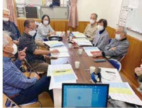
特別委員会による社協ヒアリング

「つくり指標」にうたわれている6分野全てとしており、委員会の場では、毎回一つ一つの分野をとりあげて集中的な議論を行うというのを積み重ねてきました。対象の6分野は次の通りです。