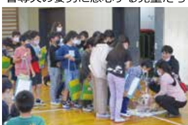
盲導犬の姿勢に感心する児童たち

招き、盲導犬との生活や視覚障害がある方の暮らしぶりについての話をさせていただきました。