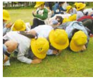
ルーペで何が見えたかな？

一年生は10月6日、生活科「あきとなかよし」の学習の一環として、自然に詳しい方を講師に迎え、地域