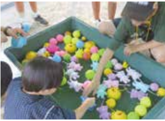
カラフルなヨーヨーすくい