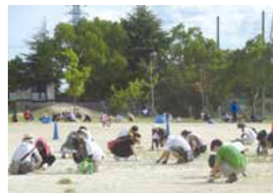
志津南小学校清掃

10月には今回体験できなかった複数の職種の方を講師に招き、それぞれの生き学を予定す。