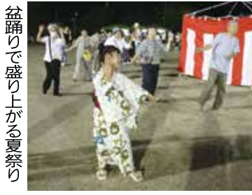
盆踊りで盛り上がる夏祭り

この様子に、「お祭りはいつですか?」「子どもが『お祭りやってくる』と言うんですけれど」といった問い合わせも多くありました。