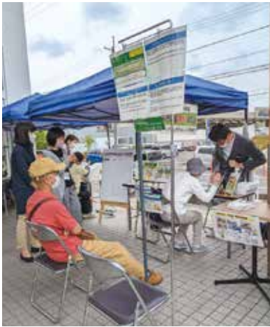
屋外でのベジチェック風景